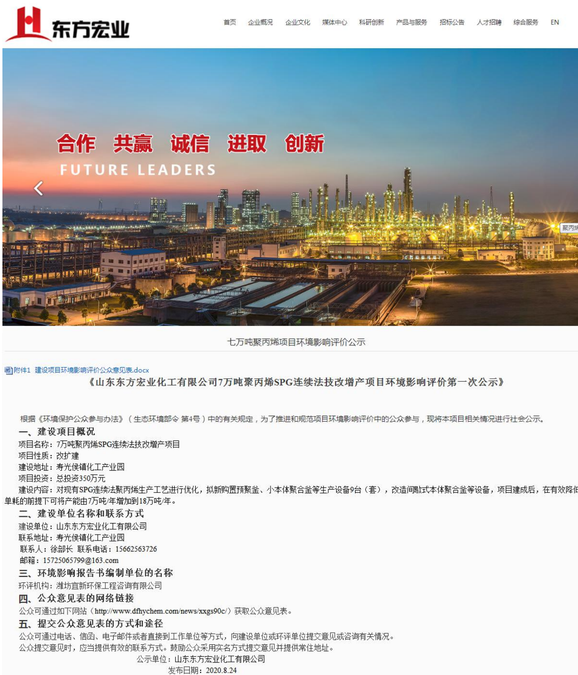
图 2.2-1 网上第一次公示截图

2020 年 8 月 24 日至 2020 年 9 月 4 日，在公司网站（ http://www.dfhychem.com/news/xxgs90c/ ）对建设项目进行了第一次公示，并附上公众意见表作为附件。公示截屏见图 2.2-1。网络公示期间未收到公众反馈意见。