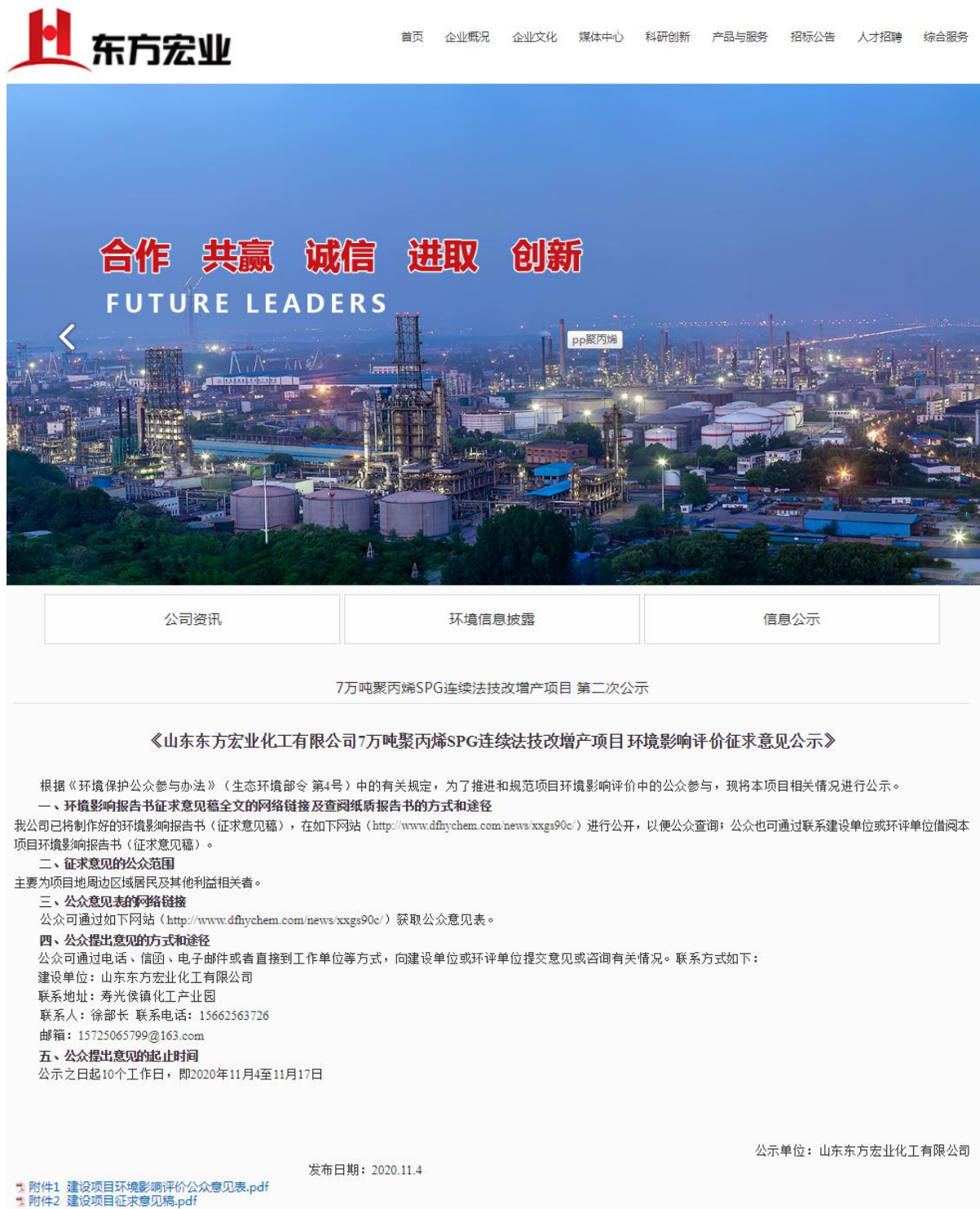
图 2.2-1 网上第二次公示截图